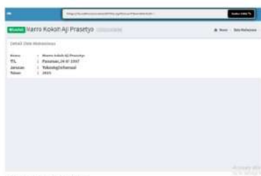
Gambar 6 Halaman Detail Mahasiswa