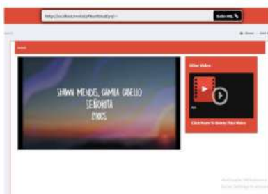
Gambar 7 Halaman Streaming Video

Halaman ini terdapat video yang bisa diputar langsung dengan alamat URL sudah Terenkripsi