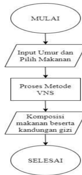
Gambar 1. Diagram Alir Sistem

Pada Gambar 1 menjelaskan tentang alur sistem. User atau penderita anemia memasukkan umur dan memilih 5 jenis makanan, selanjutnya proses pencarian solusi komposisi makanan diselesaikan menggunakan metode VNS. Komposisi makanan berupa